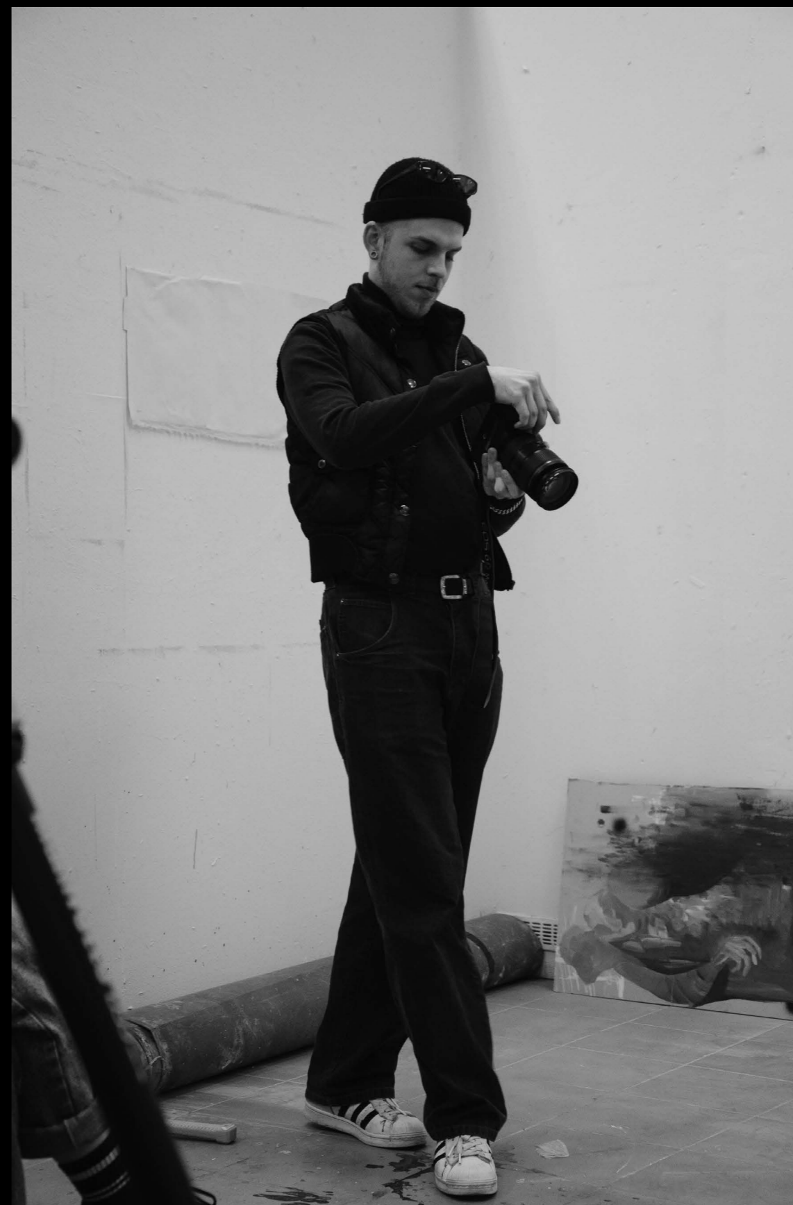
Fot. Olga Sztangret